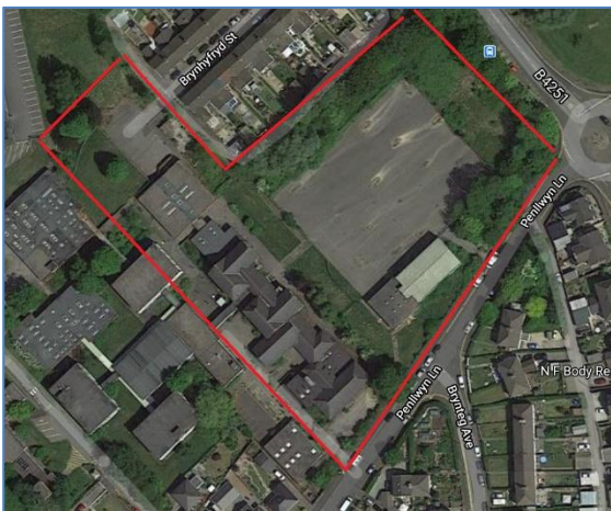
Y Safle Presennol